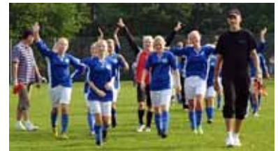
Glädje efter vunnen match