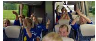
Glädje i bussen efter vinst med 5-0